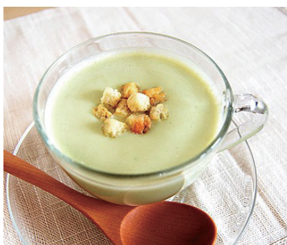
アボカドのスープ

主にメキシコが原産地です。輸入果物の中では大変女性に人気が高い商品です。『最も栄養価が高い果物』としてギネス認定されていたり、『森のバター』と呼ばれることでも有名ですね。レシピの定番はサラダですが、最近ではスープ、チーズを乗せて焼くなど加熱して食べられる方も多いそうです。